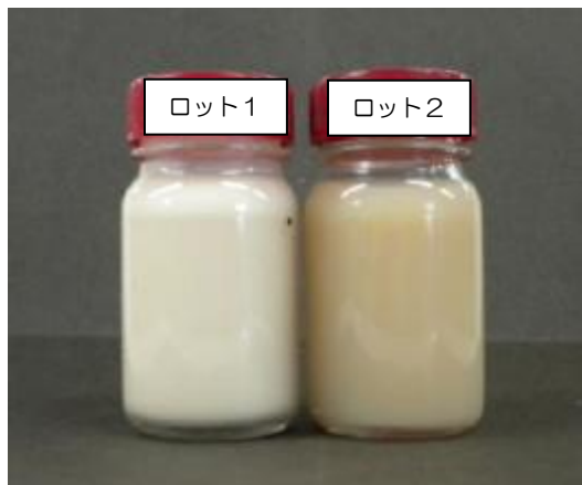
カルナバワックスロットによる外観の差